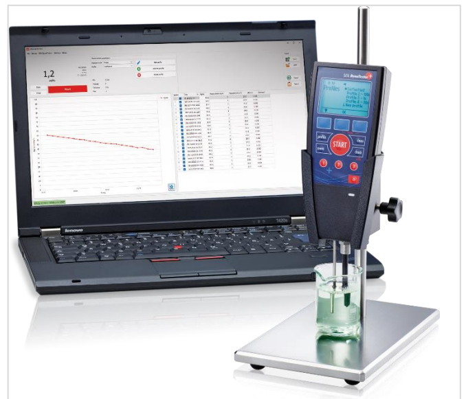
Abbildung 2: SITA DynoTester+

Für die Überwachung der Reinigungs- und Spülbäder wird der SITA DynoTester+ für stichprobenartige Messungen eingesetzt. Das mobile Tensiometer misst problemlos die aktuelle Oberflächenspannung des jeweiligen Bades, um zu testen, ob die Tensidkonzentration den Sollwerten entspricht. Sollte dies nicht der Fall sein kann entsprechend reagiert werden.